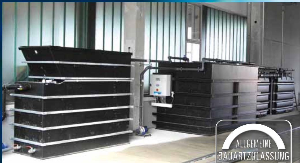
Typ MH BioFlot SK mit komplett oberirdischen Becken (10 m 3 /h)