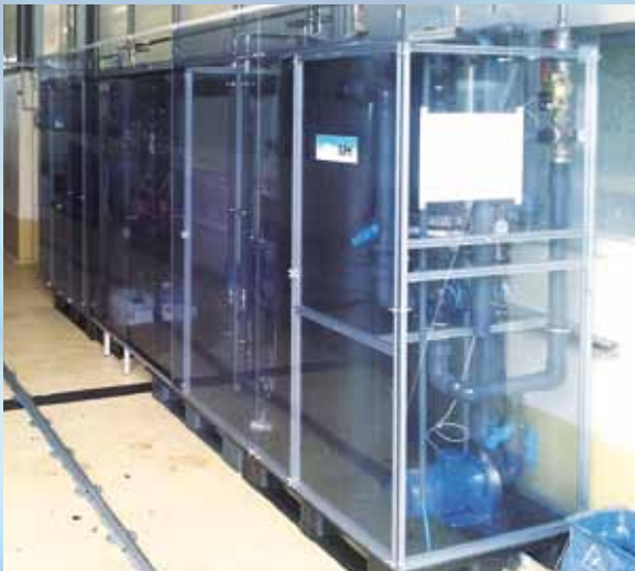
MH-BioDisc mit Einhausung direkt in der Waschhalle (10 m³/h)