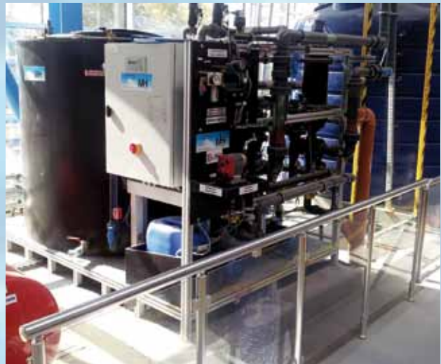
MH-BioDisc-Trainwash (35 m³/h)