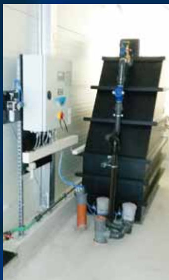
Typ MH -BioFlot SU (bis 4 m 3 /h)

Außer der einmaligen Startbestückung mit aktivem Biomaterial, werden keine weiteren chemischen Verbrauchsstoffe benötigt.